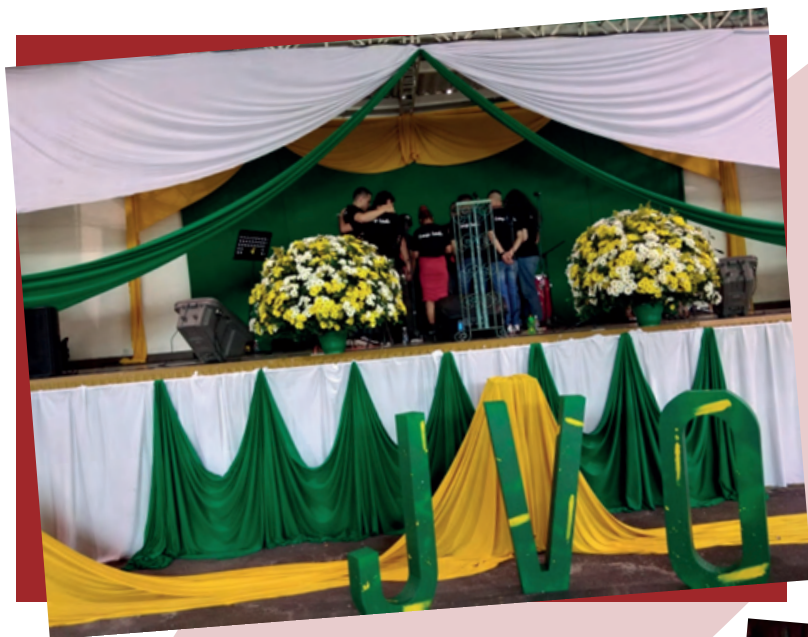
Encuentro arquidiocesano de grupos juveniles vicaria del Oriente, en la normal superior antioqueña sábado 23 de Julio de 2022